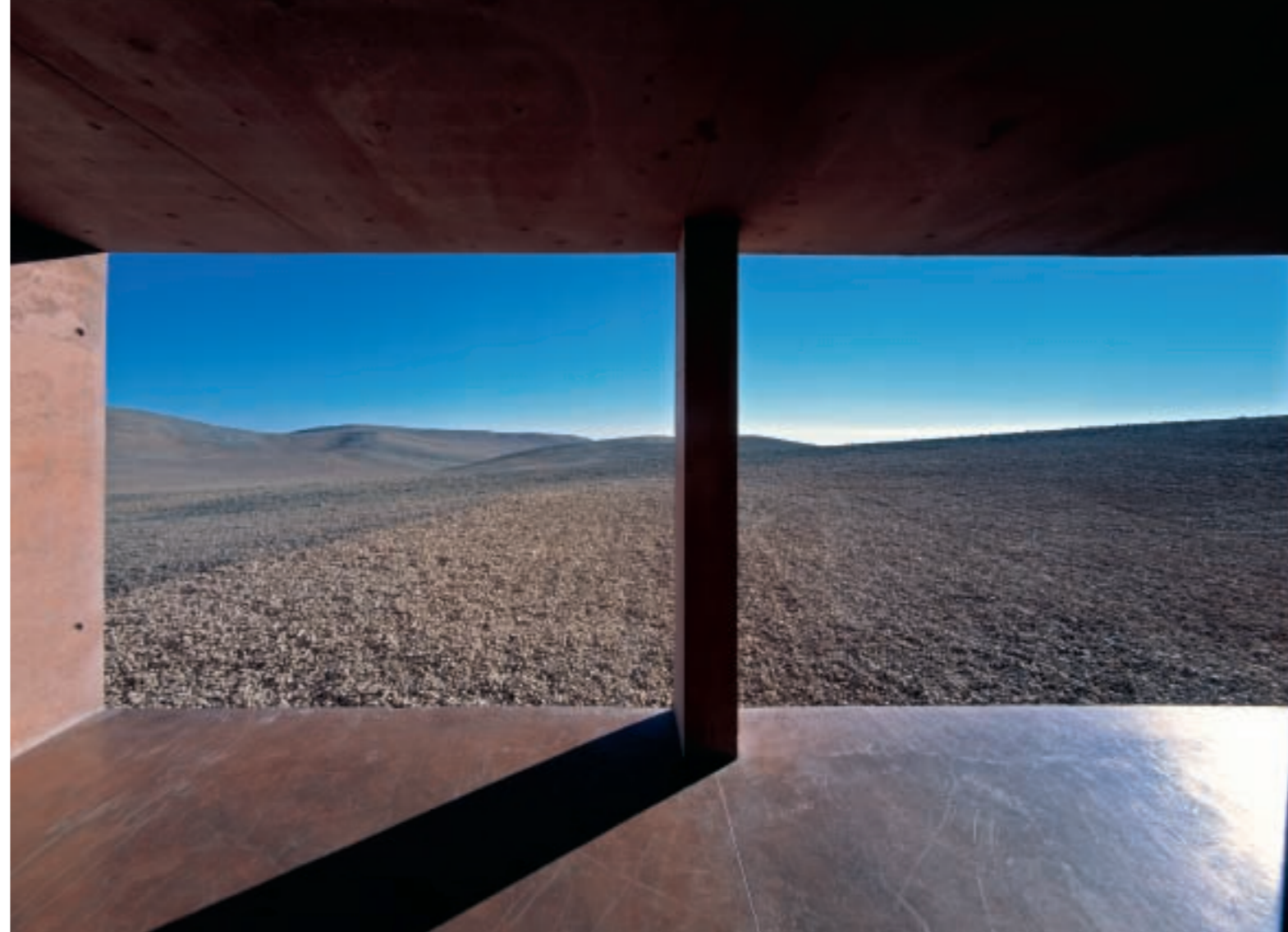
Oben: Ausblicke Links: Eingangshalle mit Pool