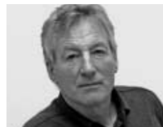
Prof. Fritz Auer

The color saturation of the structural elements strengthens the monolithic character of the building, enhanced by the fact that the interior wall surfaces were also left untreated.